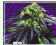
Haze 19x Skunk 32,20EUR